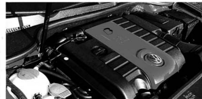
OPTIMIERT Kraftvoller Turbo-Anschub gepaart mit akzeptablem Verbrauch

zeugt der B&B GTI mit einem jetzt wieder deutlich spürbaren Turboschub. Nach einem sanften Ladereinsatz knapp über Leerlaufdrehzahl setzt dieser GTI ab 3000 Umdrehungen zum Sprung nach vorn an. Dass der Motor trotz der Änderungen nichts von seiner Drehfreude eingebüßt hat, ist lobenswert. Zusätzliche Freude bereitet die B&B-Schaltführung: Nochmals präziser als beim Original verkürzen sich die Wege spürbar. So gelingt der Sprint auf 100 km/h um knapp eine Sekunde schneller (Serie: 7,6 s). Doch nicht nur die Verbesserung der Fahrwerte stand auf dem Programm. Passend zu den Serienstoßdämpfern abgestimmte