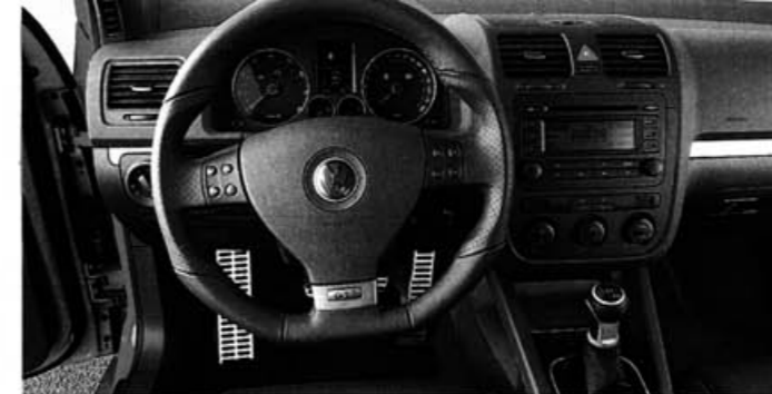
SERIE Lederlenkrad und Metallapplikationen bieten kein Verbesserungspotenzial